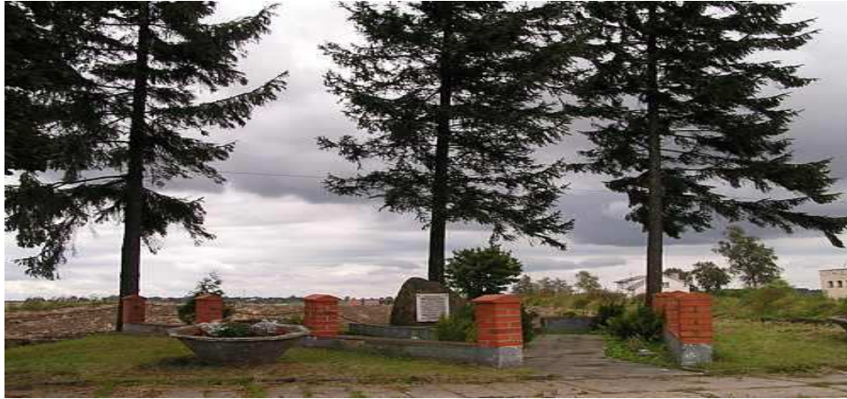
Obelisk upamiętniający bitwę pod Trzcianą z 27 VI 1629 r.