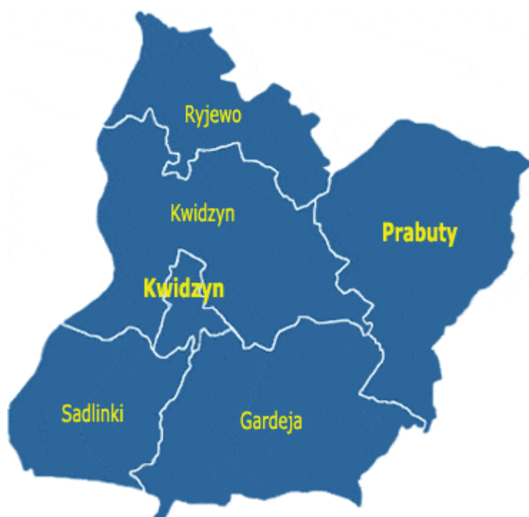
Rysunek 3 Położenie Gminy Ryjewo na tle Powiatu Kwidzyńskiego (źródło:www.gminy.pl)

Przez teren gminy przebiega trasa rowerowa "Doliną Dolnej Wisły" i "Szlak Kopernikowski" biegnący z Grudziądza do Olsztyna. Przy drodze w kierunku Sztumu wije się wzdłuż strumieni uchodzących do zbiornika wodnego malownicza ścieżka spacerowa. Na terenie Gminy znajdują się liczne gospodarstwa agroturystyczne, położone w atrakcyjnych miejscach z wieloma atrakcjami i ciekawymi propozycjami na spędzenie wolnego czasu.