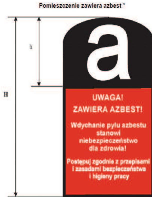
Rysunek 1 Graficzny wzór oznakowania azbestu i wyrobów zawierających azbest

Prace związane z usuwaniem wyrobów zawierających azbest prowadzi się w sposób uniemożliwiający emisję azbestu do środowiska oraz powodujący zminimalizowanie pylenia poprzez: